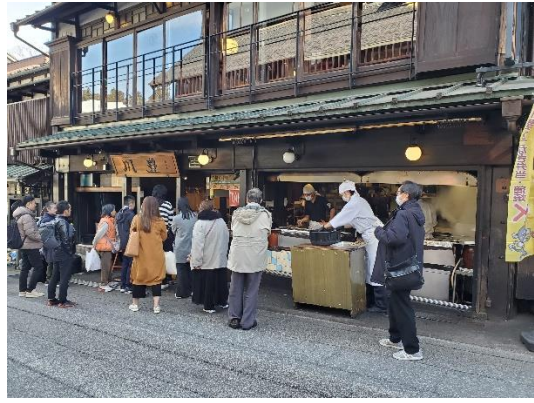
参道もまだ人通りは少なかったですが、開店前なのに「川豊」の前だけは人だかり。