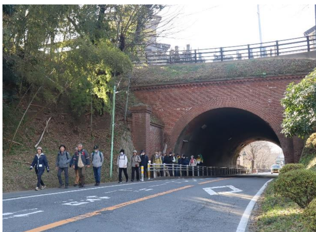
成宗電気軌道のトンネルを通過して成田山へ

JR成田駅西口歩道橋⇒成宗電気軌道⇒成田山新勝寺⇒並木町不動尊⇒不動尊供養塔と護摩木山供養碑⇒西藏院(真言宗)本堂と薬師堂⇒京成酒々井駅 ※電車にて京成佐倉駅へ(納会)