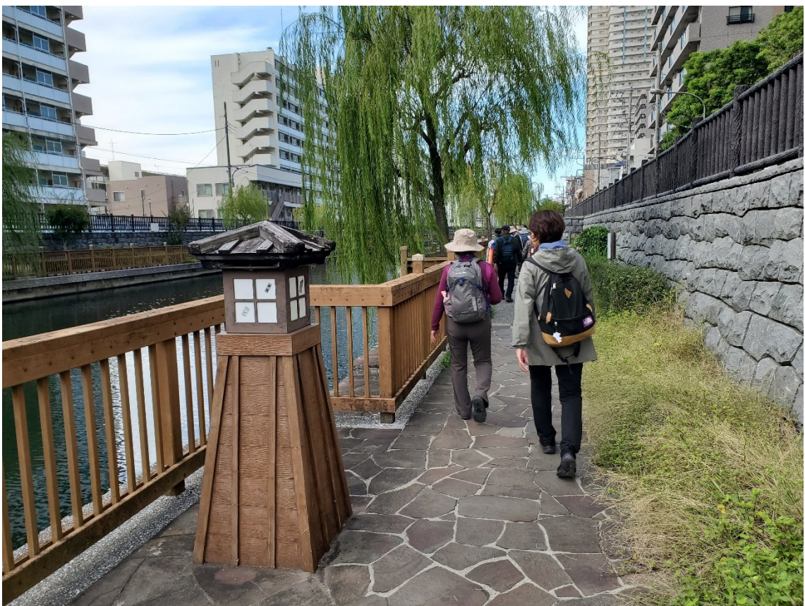
中川番所を越え、小名木川沿いを歩く