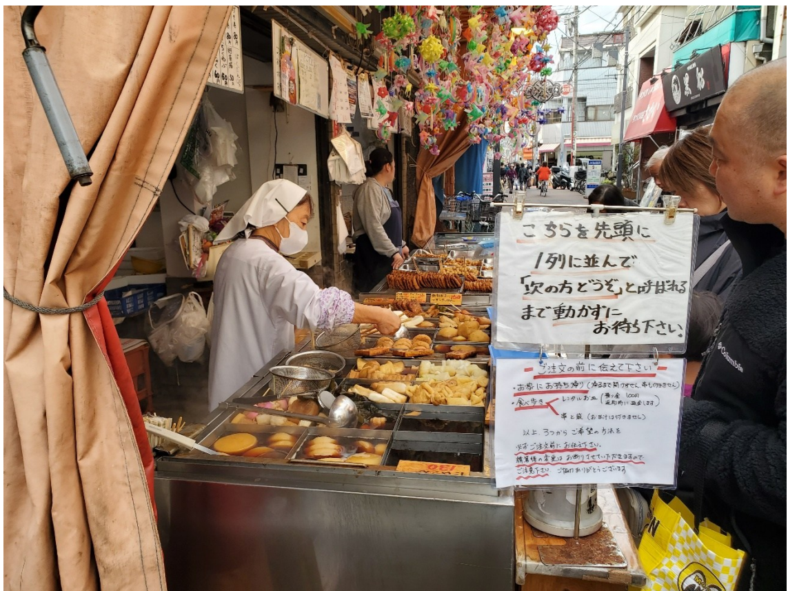
砂町銀座にておでんを買う