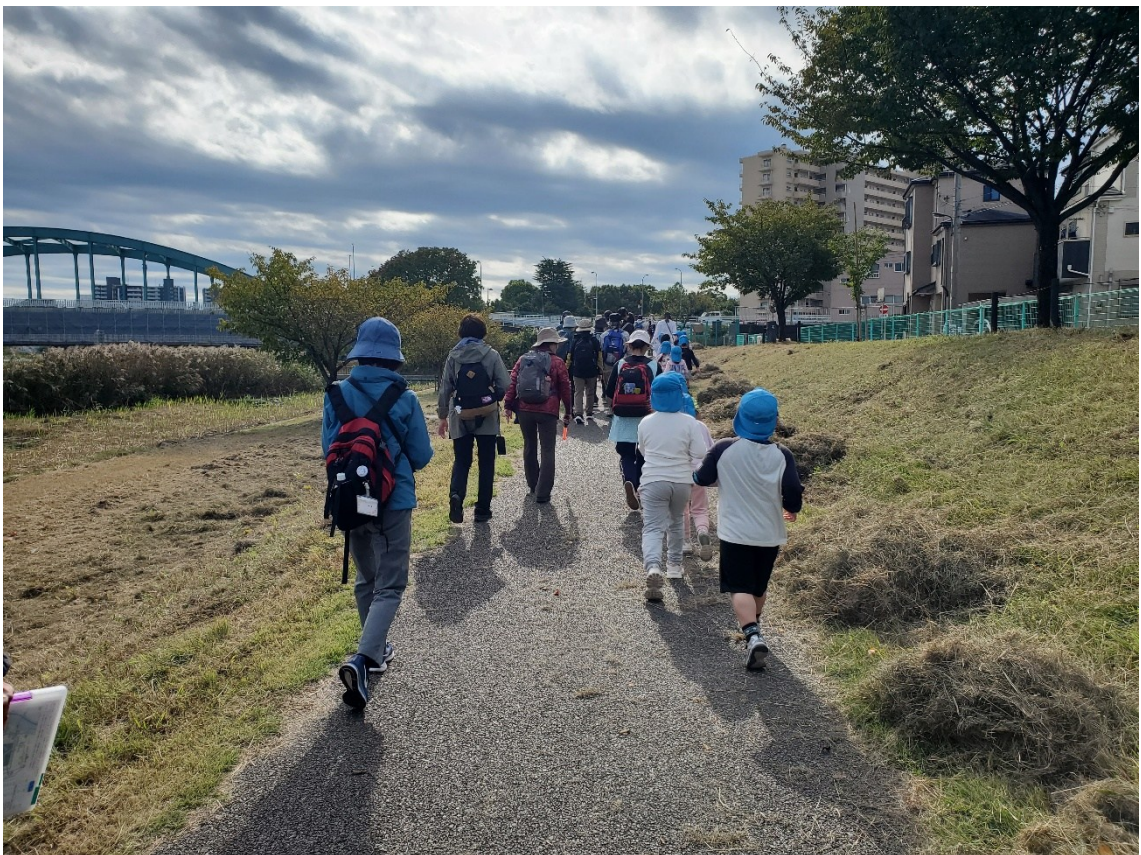
途中、園児たちと一緒に歩く