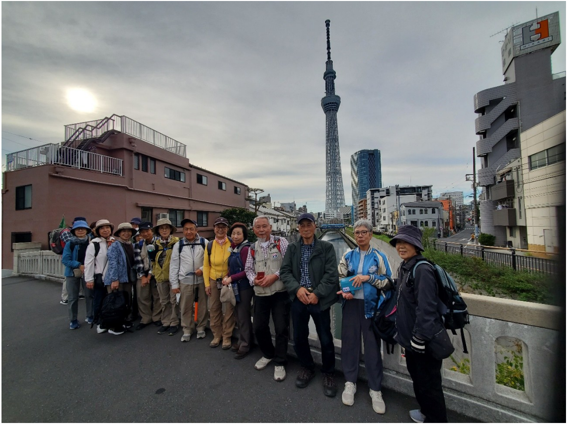
スカイツリー前に到着