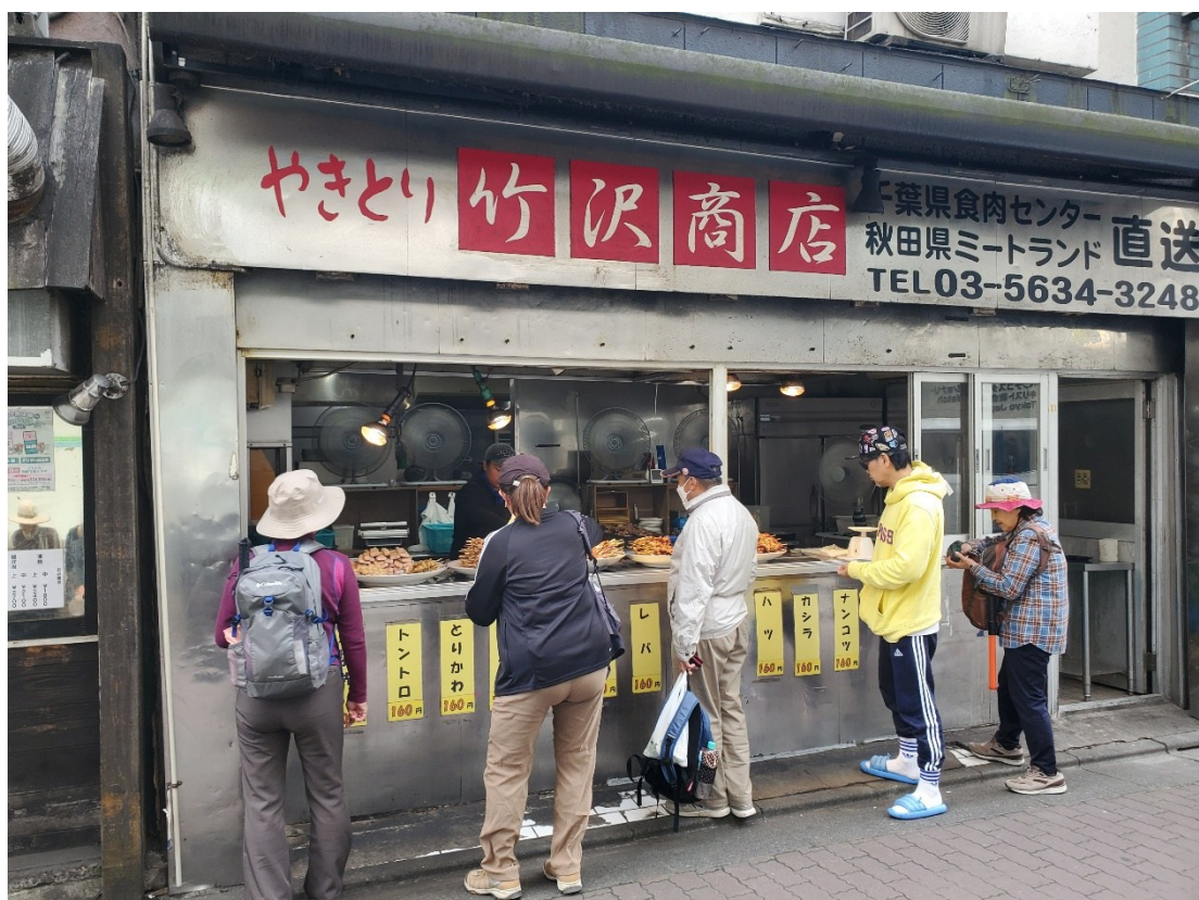
名物やきとりも大好評！！