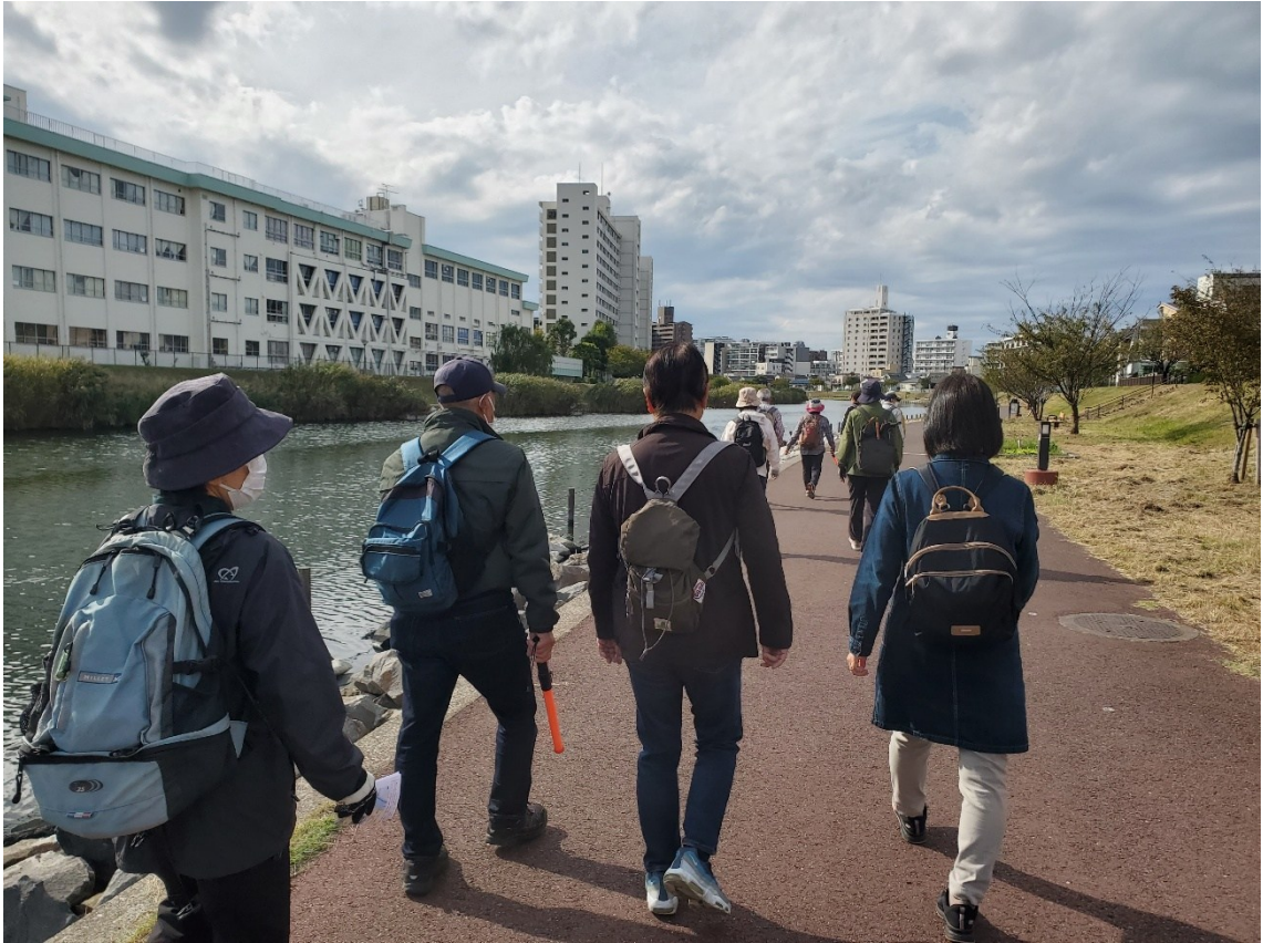
出発、旧中川沿いを歩きます