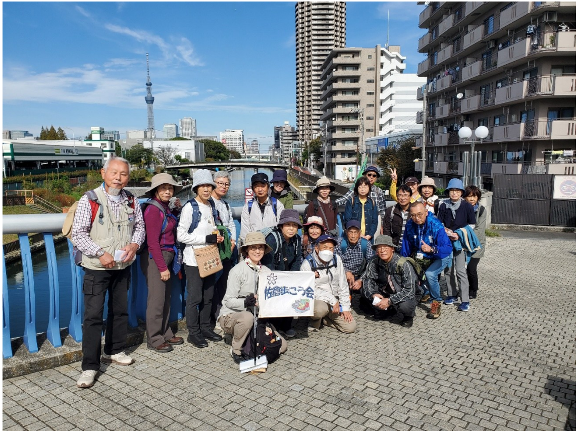
小名木川クローバー橋にて