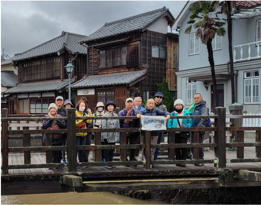
小野川にかかる「ジャージャー橋」にて集合写真。 橋の下側につけられて大樋を流れる水が、小野川にあふれ落ちて「ジャージャー」と音を立てるので、「ジャージャー橋」の通称で親しまれています。