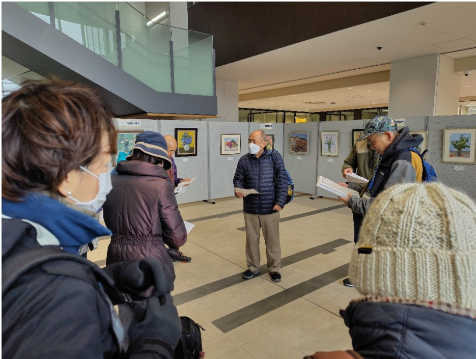
朝礼は、駅から歩いてすぐの「みんなの賑わい交流拠点コンパス」にて実施。図書館、ホール、子育て世代支援施設、観光情報発信など多様な機能を併せ持つ複合施設で、“交流の拠点”、“集客・魅力創造の拠点”、“生活支援・学び・育成の拠点”の役割を担うすばらしい施設でした。