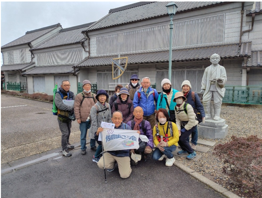
伊能忠敬の石像前で集合写真（伊能忠敬記念館裏）。