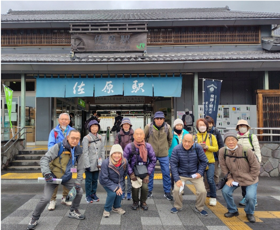
JR 佐原駅集合。1週間順延になったことと、天候が不安定のため、参加者は14名と少人数になりましたが、元気よく佐原駅をスタートです。