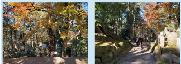
成田山公園を散策、まだ少し紅葉が残っていました