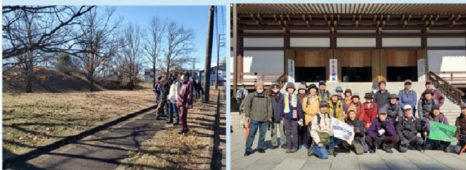
途中で古墳群発見